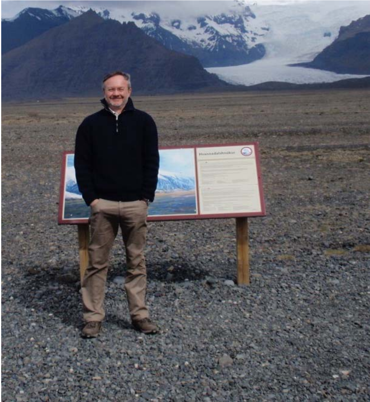
Vor dem Vatnajökull, dem Liefergebiet der Trübeströme, die durch das NOAMP-Gebiet laufen.

sicher was dran, wenn ich an mein Berufsleben zurückdenke. Also, schauen wir mal, was die Zukunft bringen wird.