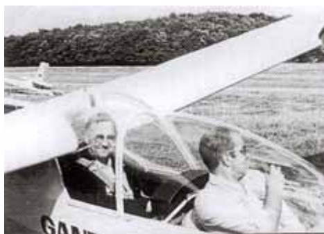
Versuch, experimentelle Erfahrung im Segelflugzeug zu gewinnen