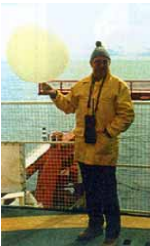
Demonstration eines Radiosondenstarts an Bord der "Polartern"