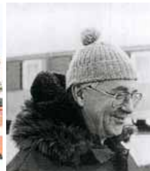
Polnische Station Arctowski