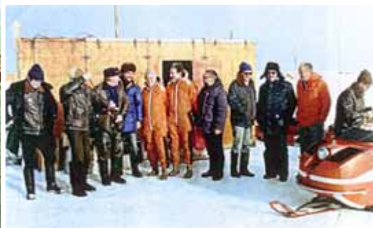
Russische Station Druzhnaya