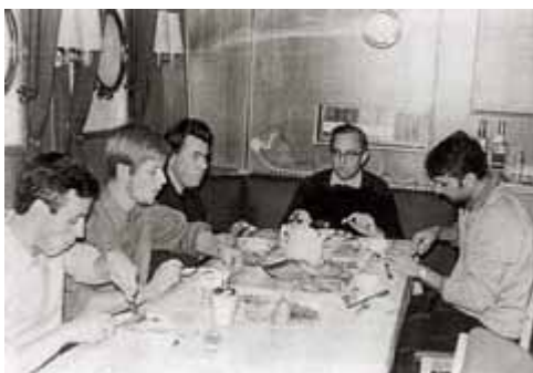
Mit Kieler Studenten an Bord des Kieler Forschungsschiffes

Sie haben aber dann bald wieder den Ort und damit das Arbeitsgebiet gewechselt. Warum das?