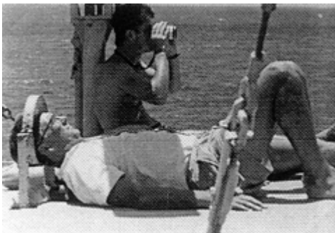
1965 –Bojensuche: Grassl sucht–

Ich kann mich nicht als Klimaforscher verstehen. Mit meinen Mitarbeitern haben wir die Entwicklung von Grenzschichtwolken sowohl durch Experimente wie auch durch Modelle untersucht. Deren Ergebnisse hatten natürlich auch Bedeutung für Klimamodelle. An der Entwicklung der Logistik der Klimagrundlagenforschung war ich beteiligt. Aus meiner Erfahrung im Bereich der Meeresforschung, wo das Forschungsschiff Meteor von einer staatlichen Institution bereedert wurde und den Wissenschaftlern zu 50% seiner Einsatzzeit zur Verfügung stand, war ich zunächst auch für eine Bereederung des notwendigen Großrechners durch eine staatliche Institution, um die Wissenschaftler nicht mit den damit verbundenen logistischen Fragen zu belasten. Es wurde allerdings ein anderer und aus heutiger Sicht besserer Weg gewählt.