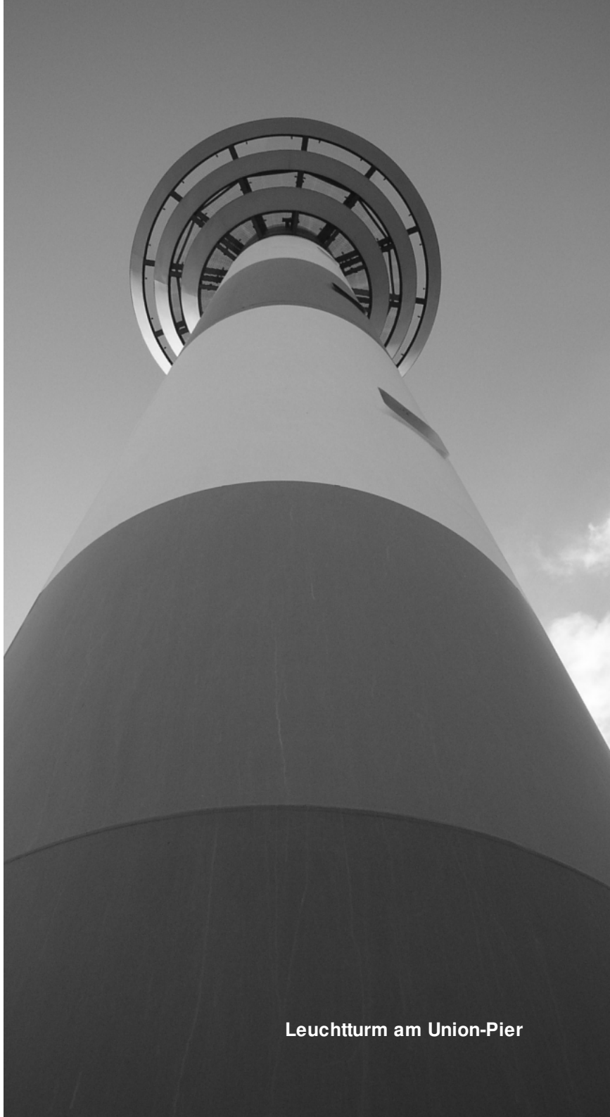
Leuchtturm am Union-Pier